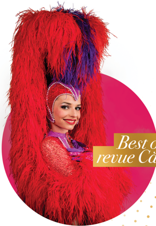
Best of revue Cabaret

PROFESSIONNELS DU SPECTACLE VIVANT DEPUIS PLUS DE 20 ANS, NOUS VOUS PROPOSONS UN CHOIX VARIÉ D'ANIMATIONS POUR VOS ÉVÈNEMENTS.